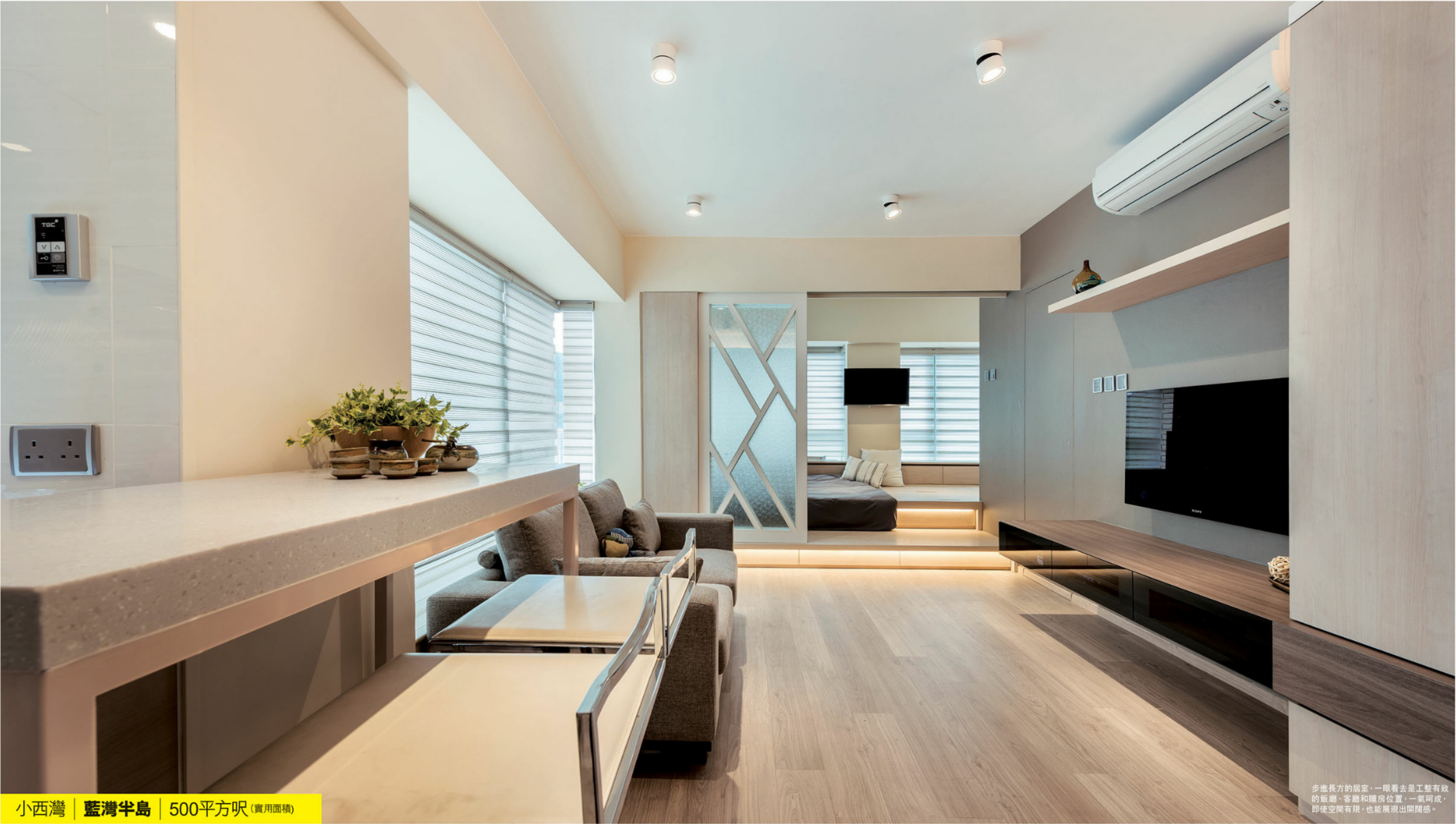
小西灣 | 藍灣半島 | 500平方呎 (實用面積)